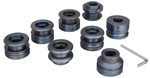
9 takım standart vals topu ve top açma anahtarı 9 set of standard rolls and roll spanner key